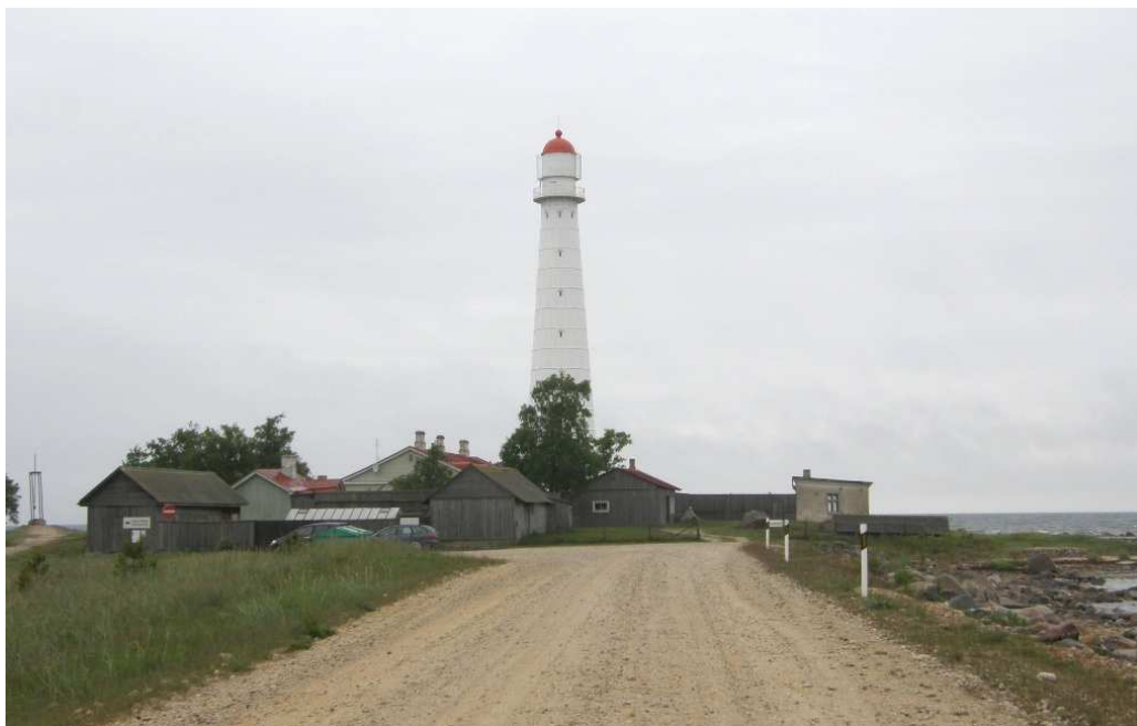
Foto 4. Vaade Tahkuna tuletornile (rajatud 1875. a). Vasakul paistab parvlaeval Estonia hukkunutele pühendatud mälestussammas – metalltorn kellaga.