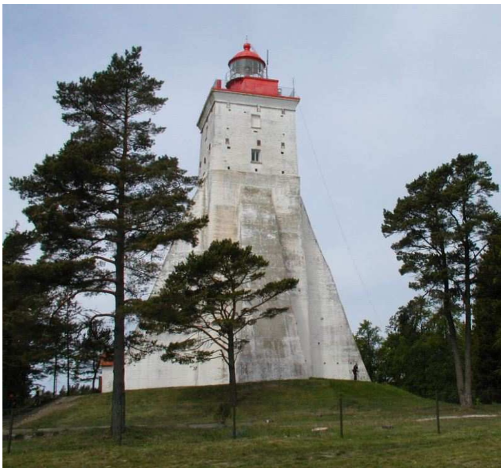
Foto 6. Vaade Kõpu tuletornile (rajatud 1531. a, kõrgusega merepinnast 102 m).