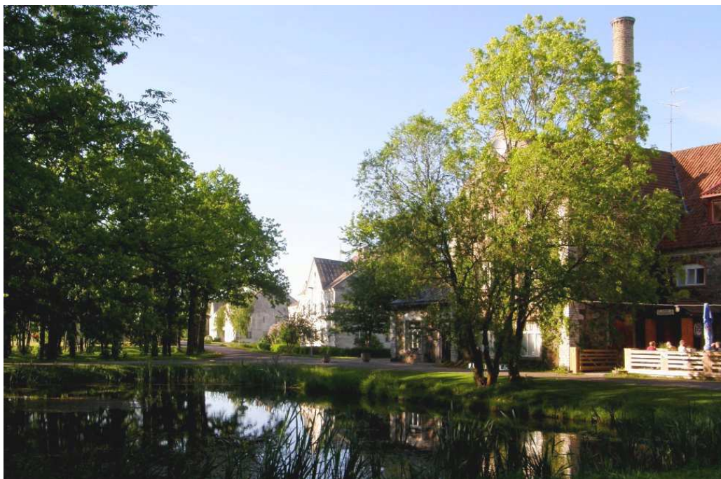
Foto 1. Uueks miljööväärtslikuks alaks määratud Kõrgessaare sadama tee piirkond on terviklik ala mis algab Viinaköögi hoone juurest.