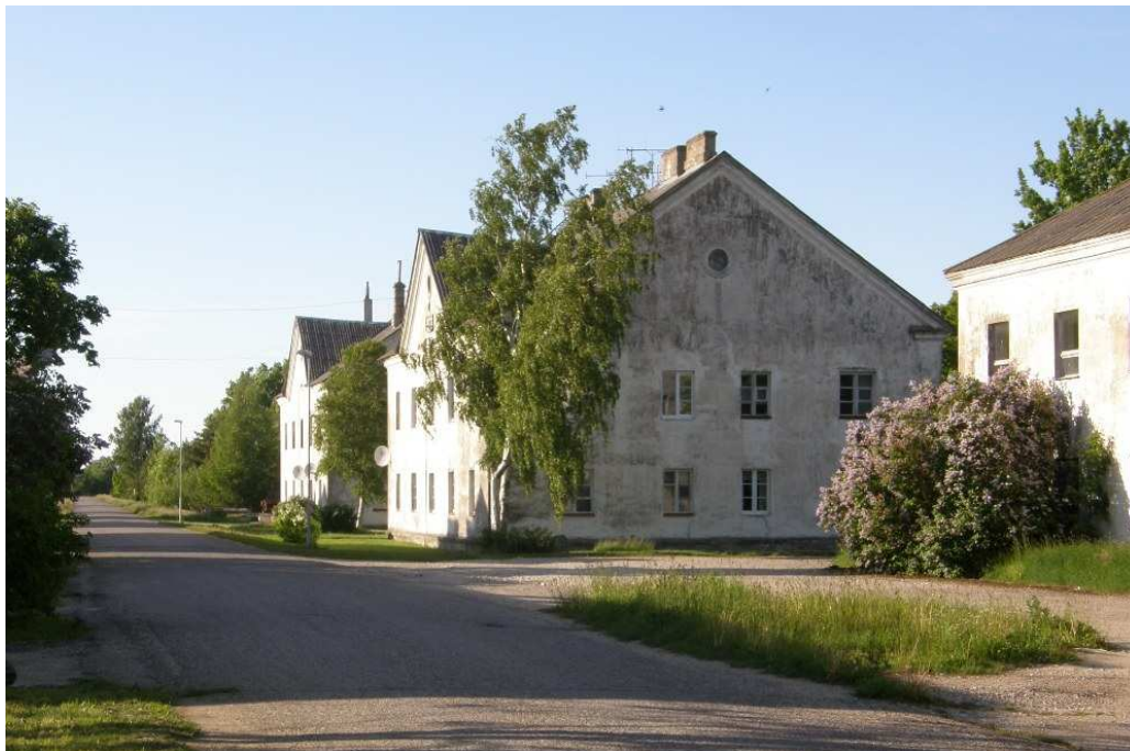
Foto 3. Kõrgessaare sadama tee piirkonna elamud on ühtse stiiliga – elamutel on säilinud algne välisviimistlus ja akende jaotus. Senist lubikrohvi ja akendejaotust tuleb alal säilitada. Otstarbekas oleks tagada hoonele ka ühtne katusekattematerjal ja värv (nt valtsplekkkatust).