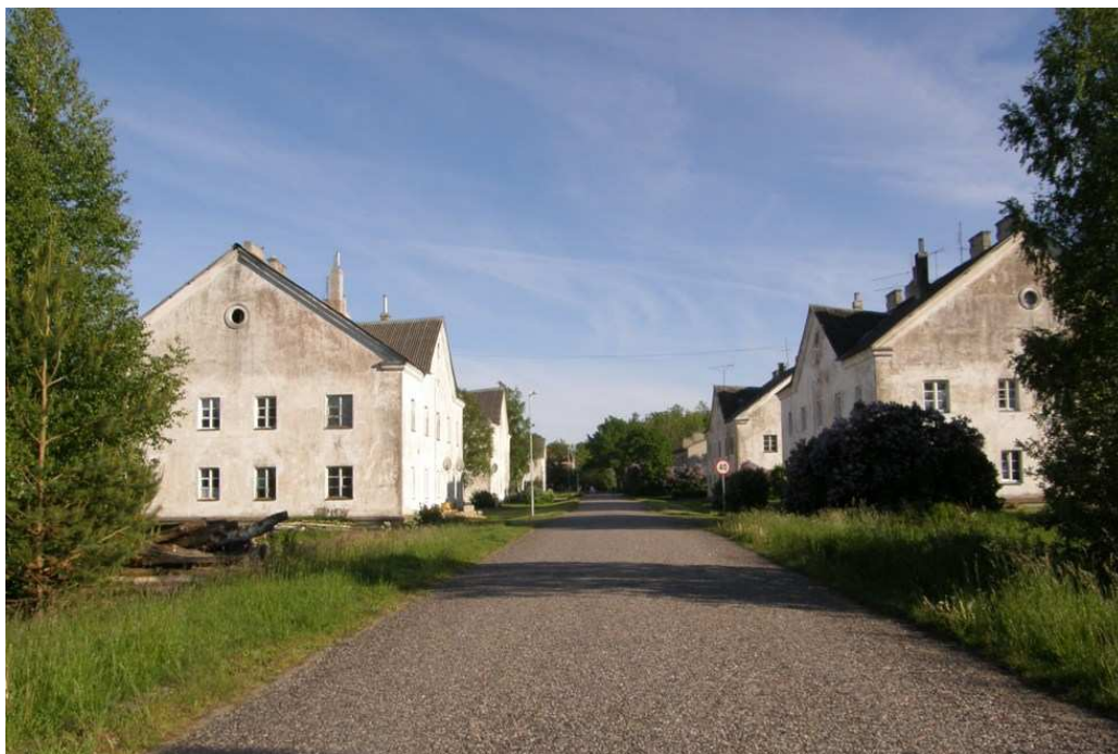
Foto 2. Vaade Kõrgessaare sadama tee piirkonna elamutele Sadama suunalt.