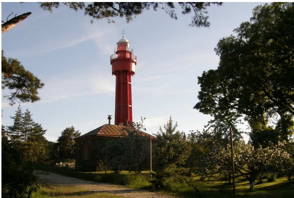
Foto 5. Vaade Ristna tuletornile (rajatud 1874. a).