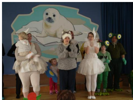
Klubi Vikerkaar noored esitasid 15.aprillil lasteaia Vigri näitetüki „Jorri suur seiklus“