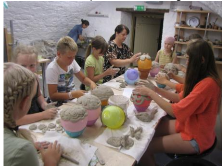
Kunstilaager Suuremõisa savikojas

Välja on kujunenud meie oma traditsioonid. Igal aastal esitleme oma töid kahel näitusel, talvel ja kevadel. Vanema rühma liikmetele, neile kes juba näidanud oma püsivat huvi ja pühendumist, on alati oodatavaks sündmuseks kahepäevane kunstilaager.