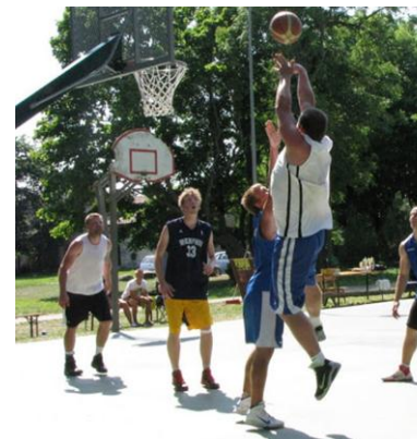
Kõrgessaare tänavakorvpalliturniir