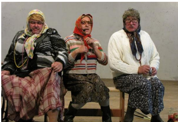
Laheda valla taidlejad Viskoosas